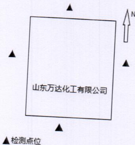
附件 1: 山东万达化工有限公司厂界噪声检测分布图